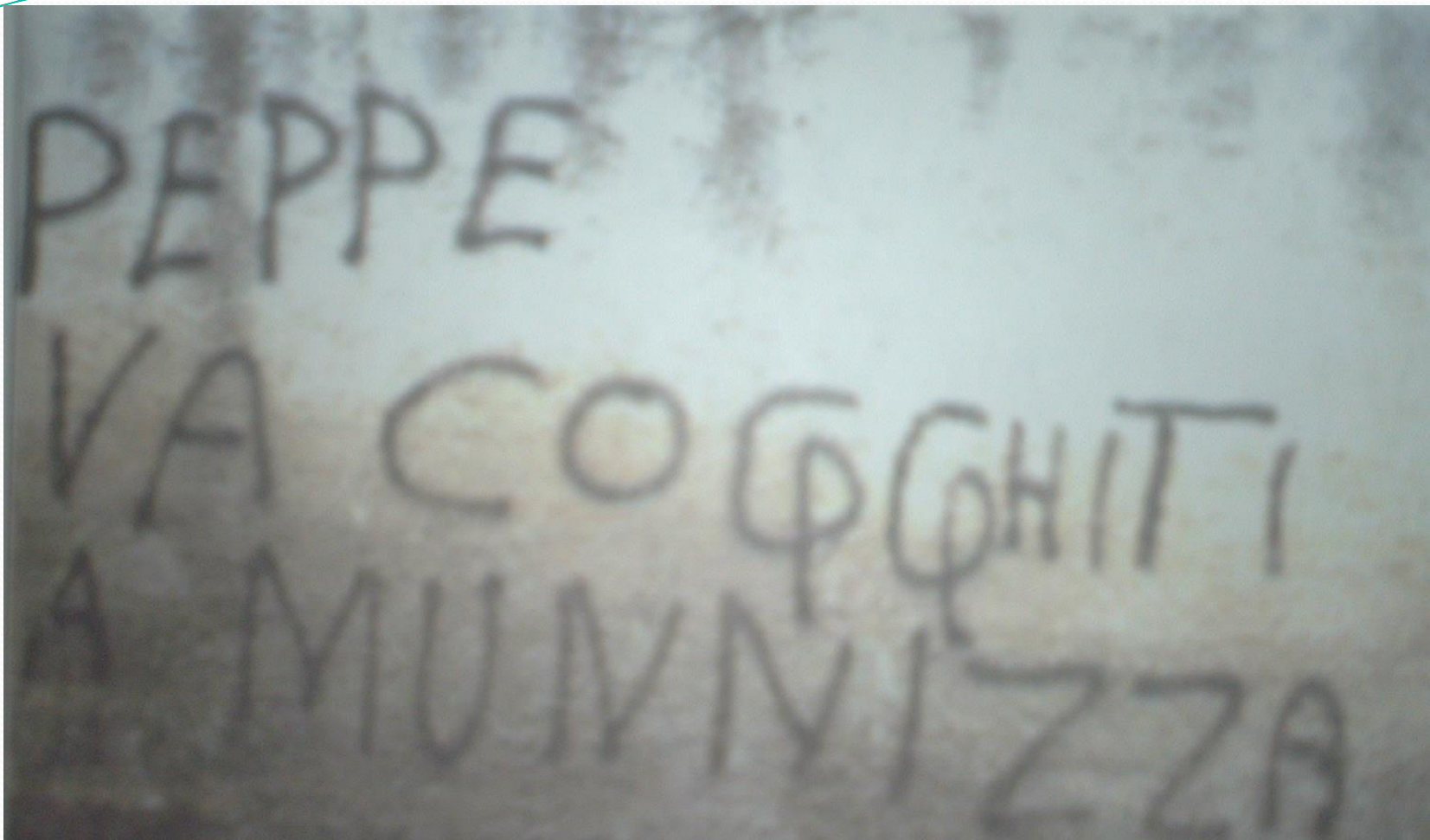
Peppe va cogghiti a munnizza